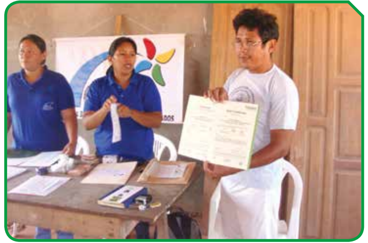
OECOM Loma Alta

E BA cumplió su compromiso con las Organizaciones Económicas Comunitarias—OECOM y Asociaciones de recolectores que confiaron en nosotros y nos vendieron su producción orgánica durante la zafra 2014. En la oportunidad EBA estuvo presente en casi todas estas comunidades, y a diferencia de años anteriores, se pagó el plus de manera personal a cada recolector, reconociendo su trabajo y esfuerzo.