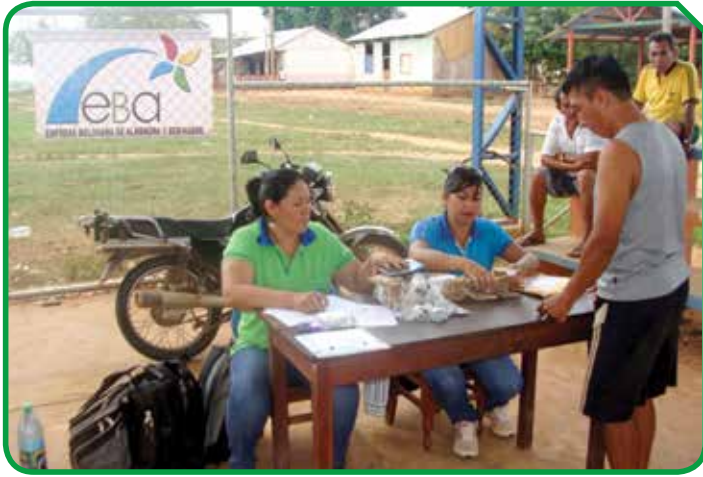
OECOM Palma Real