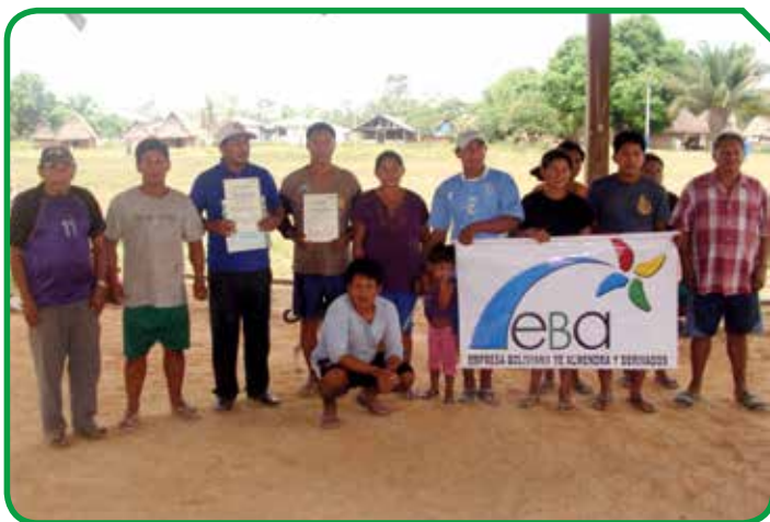
Miembros de la Asociación Pacahuara

Se espera que para esta zafra se vuelva a repetir este logro y se incentiva a que más comunidades se integren a esta forma de negocio, ya que hasta ahora EBA es la única empresa de este rubro en la región que se preocupa por distribuir entre los recolectores los excedentes generados por la certificación orgánica.